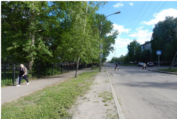
Фото на странице: 0